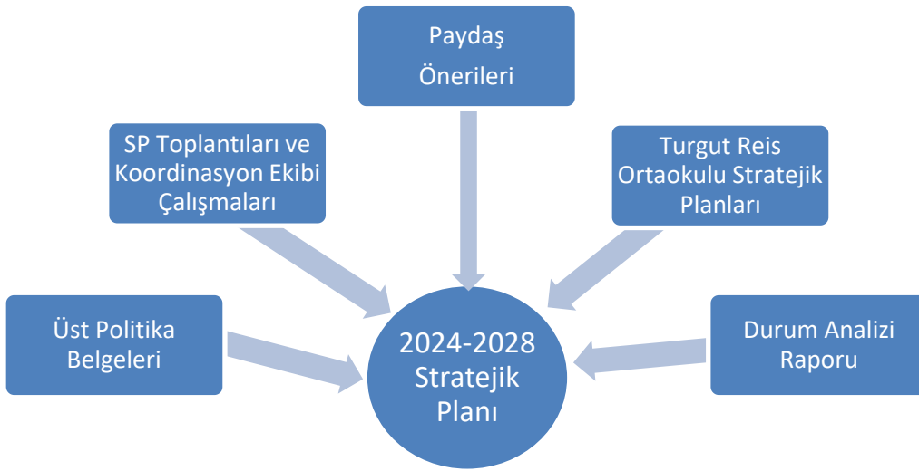
Şekil 1. Planlama Şekli

2024-2028 döneminde kullanılmış olan kurumumuza ait Stratejik Planlama Modeli Şekil-1’de belirtilmiştir. Şekil1’e göre durum analizinin gerçekleştirilerek geleceğe yönelim bölümünün tasarlanması, stratejik planın yıllık uygulama dilimleri olan performans programının hazırlanması ve uygulama sonuçlarının izlenip değerlendirilmesi kurumumuz Stratejik Planlama Model’inin ana hatlarını oluşturmaktadır. Bu kısımda yukarıdaki konular kapsamında Müdürlüğümüz 2024-2028 Stratejik Planı’nın oluşturulma süreci tamamlanmıştır.